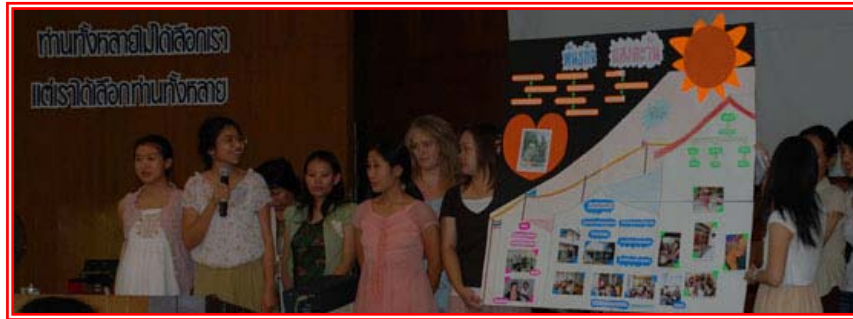
Den 1:a april välkomnades alla nya medarbetare på Baan Saeng Tawan i Thai Lanna kyrkan & vi berättade om arbetet.